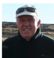
Claude Girier Amodiations